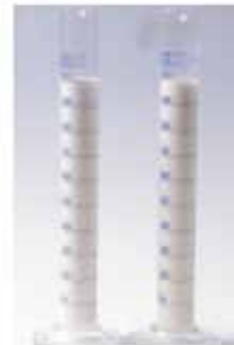
Naftanik yağ (solda) ve parafinik yağ (sağda) ile yapılan süt emülsiyonlar.