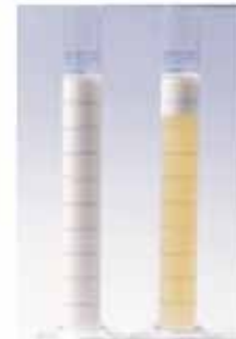
Emülsiyonların 24 saat sonraki durumları yukarıdaki gibidir.

Yanda görüldüğü gibi parafinik yağ ile oluşturulan emülsiyon ayrışma yaparken (sağda), naftanik yağ ile hazırlanan emülsiyon stabil durumdadır (solda).